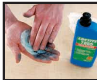
Loctite® 7855 Handreiniger Entfernt Farbe, Harz und Klebstoff. Biologisch abbaubar, ungiftig.