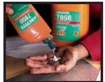
Loctite® 7850 Handreiniger Natürlicher Handreiniger aus Zitruschalenextrakten, mineralölfrei, mit wichtigen Hautpflegesubstanzen. Biologisch abbaubar. Ohne Wasser verwendbar. Entfernt festsitzenden Schmutz, Fett und Öl. Hinterläßt einen angenehmen Geruch. Dermatologisch getestet.